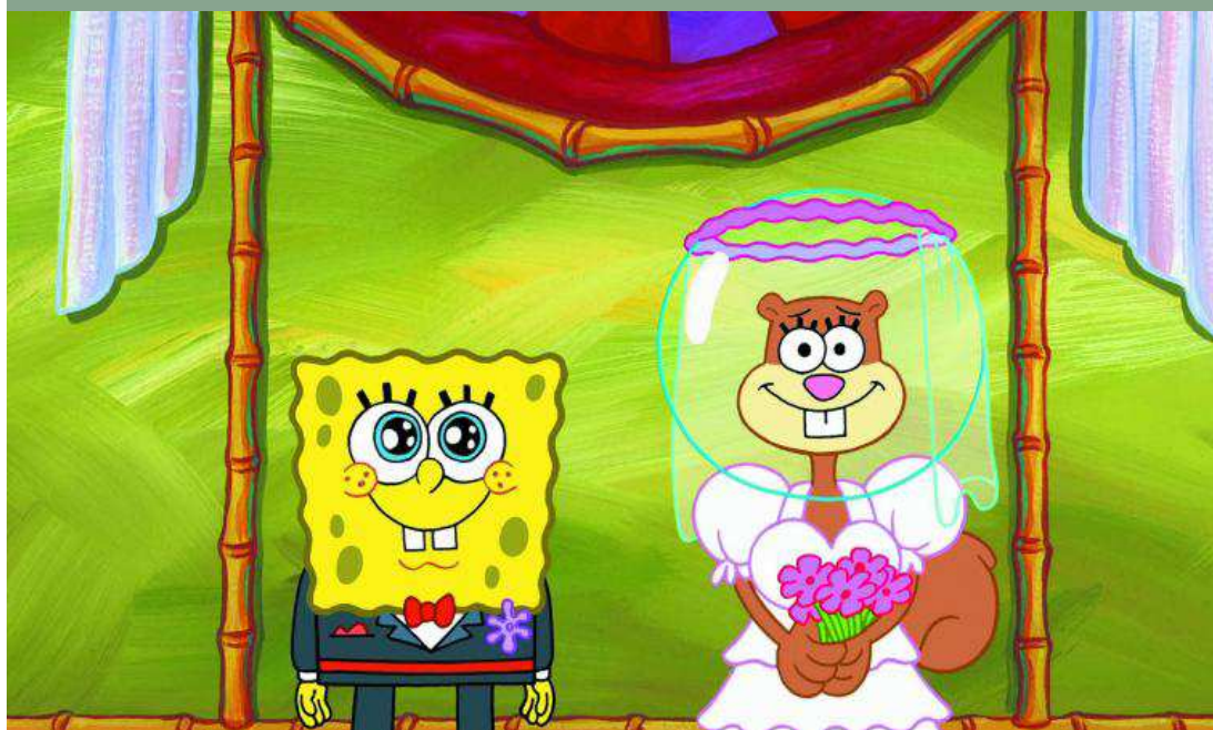
En la película 'Atrapados en el Congelador', 'Bob Esponja' y 'Arenita Mejillas' se casan en una representación teatral.

personajes que, desde el punto de vista adulto, pueden parecer bastante locos, pero conecta muy bien con la realidad que vive el niño. Está claro que los pequeños perciben el mundo desde un punto de vista totalmente distinto al de un adulto. Asimilan lo que les pasa de forma diferente y a un ritmo distinto. Bob Esponja ha sabido captar, en las tramas y las historias que cuenta, cosas que pueden pasar en la realidad del niño como la soledad, ir a colegios donde viven la diferencia, llegar a casa y que no estén sus padres porque están trabajando... Bob Esponja juega con esa realidad, pero de forma fantasiosa y a los niños les encanta. Además, fomenta la amistad y el compañerismo, temas universales que enganchan".